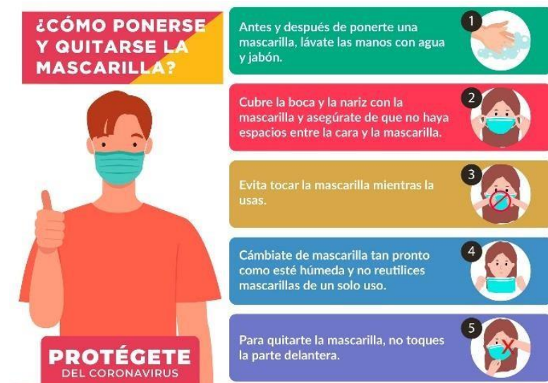
Figura 2. Uso correcto de la mascarilla