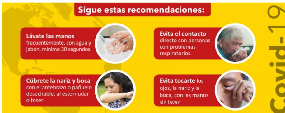
Figura 5. Recomendaciones generales preventivas