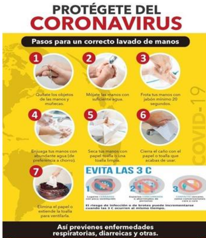
Figura 4. Lavado de manos